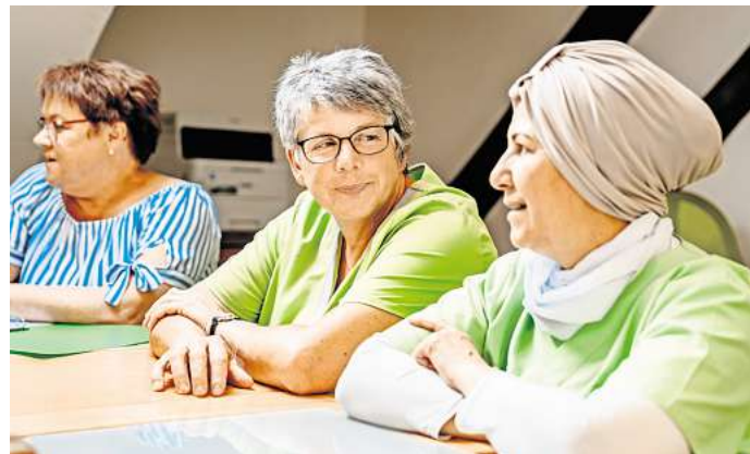
Die Ambulante Pflege Burgwedel verfügt nun auch über Palliativ-Fachkräfte.

Weitere Informationen über die Ambulante Pflege Burgwedel, Vor dem Hagen 2, 30938 Burgwedel-Fuhrberg, gibt es im Internet unter www.ambulante-pflege-burgwedel.de , per Telefon unter 05135-14 75 oder per E-Mail an info@ambulante-pflege-burgwedel.de .